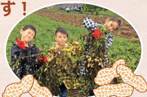
(落花生はアレルギー特定原料7種に含みます)

アクセス JR 四街道駅から/市内循環バス「ヨッピー」で 「鹿放ヶ丘ふれあいセンター」下車 (約 15分) 四街道 IC から/車で 9分、千葉北 IC (八千代・柏方面出口) から/車で 11分 (お車で越しの方は、鹿放ヶ丘ふれあいセンター駐車場をご利用いただけます。)